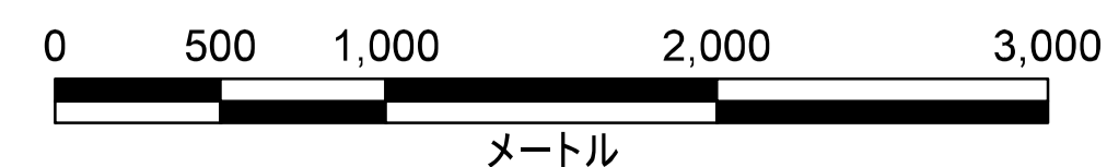
津波災害警戒区域 位置図

この地図の作成に当たっては、国土地理院長の承認を得て、同院発行の数値地図(国土基本情報)電子国土基本図(地図情報)を使用した。(承認番号 平29情使、第1125号)